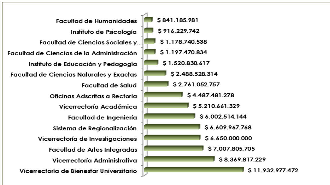
Gráfico 2.2 Total de recursos solicitados según Facultad o Dependencia.