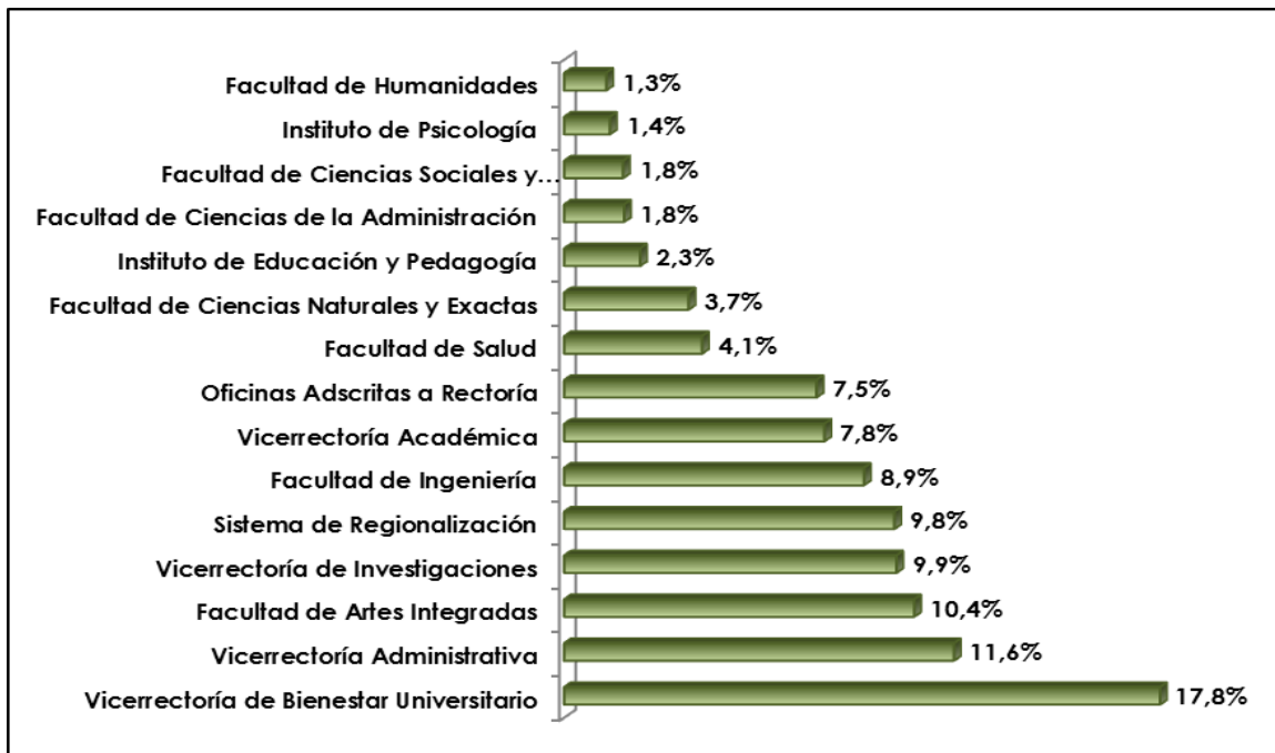
Gráfico 2.3 Porcentaje de recursos solicitados según Facultad o Dependencia.