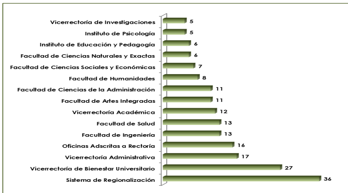
Gráfico 2.1 No. Proyectos recepcionados según Facultad o Dependencia.